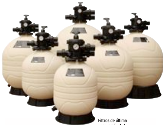
Filtros de última generación de la empresa Emaux.