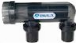
Sistema de Emaux que permite depurar el agua marina.