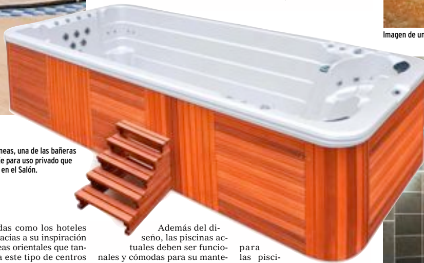
Sobre estas líneas, una de las bañeras de hidromasaje para uso privado que se podrán ver en el Salón.

cias privadas como los hoteles triunfan gracias a su inspiración zen, de líneas orientales que tanto gustan a este tipo de centros termales y que últimamente se han puesto de moda en España.