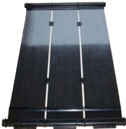
Placas solares para instalaciones deportivas de Magen Eco-Energy.