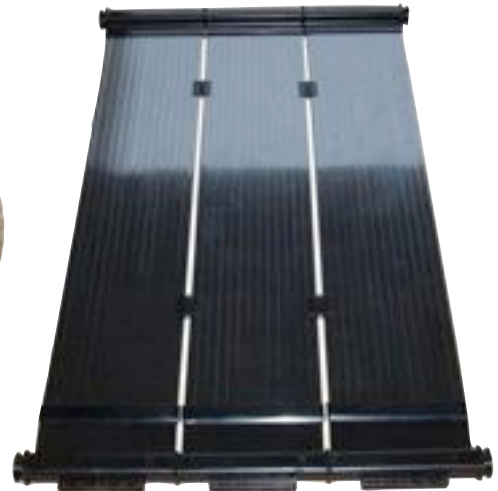
Placas solares para instalaciones deportivas de Magen Eco-Energy.