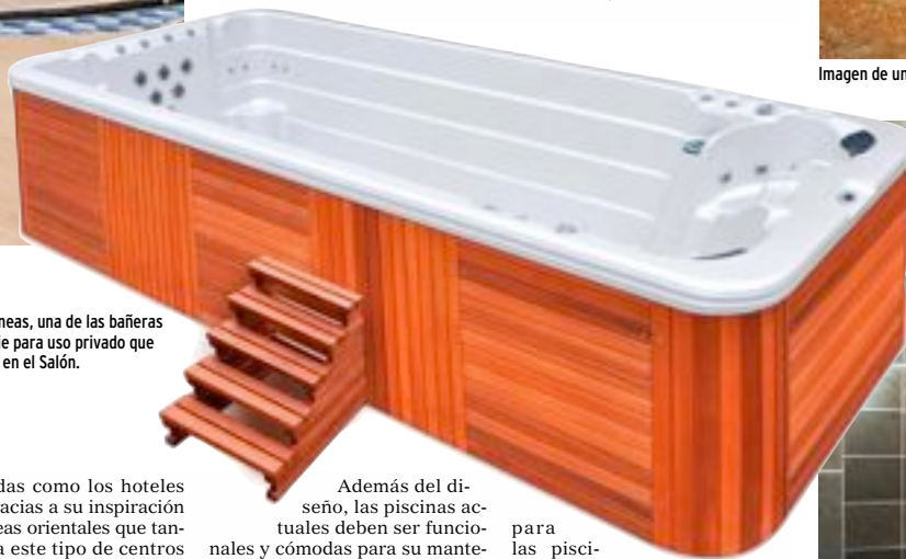
Sobre estas líneas, una de las bañeras de hidromasaje para uso privado que se podrán ver en el Salón.

cias privadas como los hoteles triunfan gracias a su inspiración zen, de líneas orientales que tanto gustan a este tipo de centros termales y que últimamente se han puesto de moda en España.