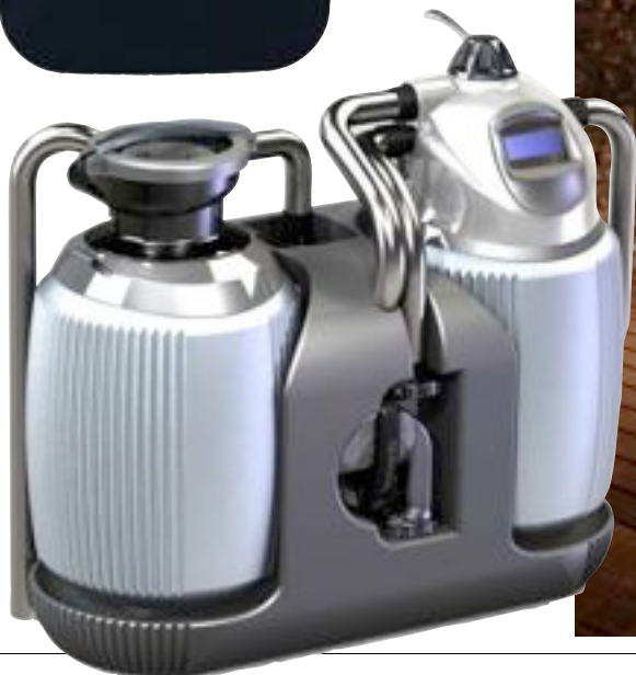
El suelo de una piscina de madera tecnológica. A la izquierda, equipo para tratar aguas de Poolrite.