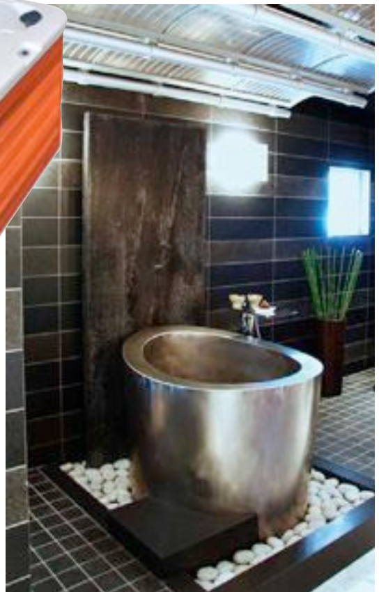
Uno de los baños que propone Diamonds Spa.

Además del diseño, las piscinas actuales deben ser funcionales y cómodas para su mantenimiento y conservación. Son muchas las empresas que se encargan de rehabilitar construcciones en mal estado. Sin embargo, también resulta imprescindible que sean lugares seguros para el baño, un aspecto que cada vez se tiene más en cuenta en el mercado.