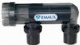
Sistema de Emaux que permite depurar el agua marina.