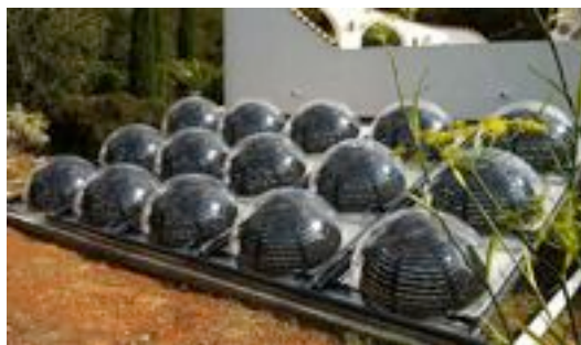
Imagen de un panel de colectores solares esféricos de Bubble Sun Collector.