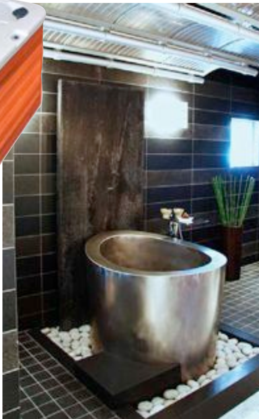
Uno de los baños que propone Diamonds Spa.

Una revolucionaria solución a este problema se encuentra en los colectores solares esféricos. Aquí no importa si la cubierta es plana o inclinada o si está dirigida hacia el norte, sur, este u oeste. Se trata de un pequeño dispositivo de menos de un metro que se instala de una forma muy rápida y sencilla.