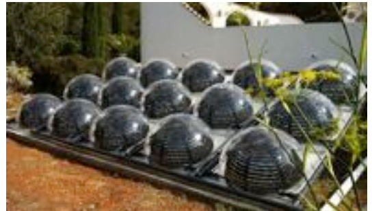
Imagen de un panel de colectores solares esféricos de Bubble Sun Collector.