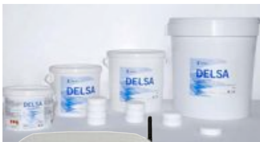
A la izquierda, un sistema de supervisión que controla el estado de la piscina a través de un 'smartphone'. Arriba, las nuevas tabletas de Ercros sin ácido bórico.

Se trata de una especie de pulsera digital que emite una señal cuando la persona que la lleva sufre un accidente acuático, y manda una señal a través de un ordenador al teléfono móvil para así alertar del posible accidente.