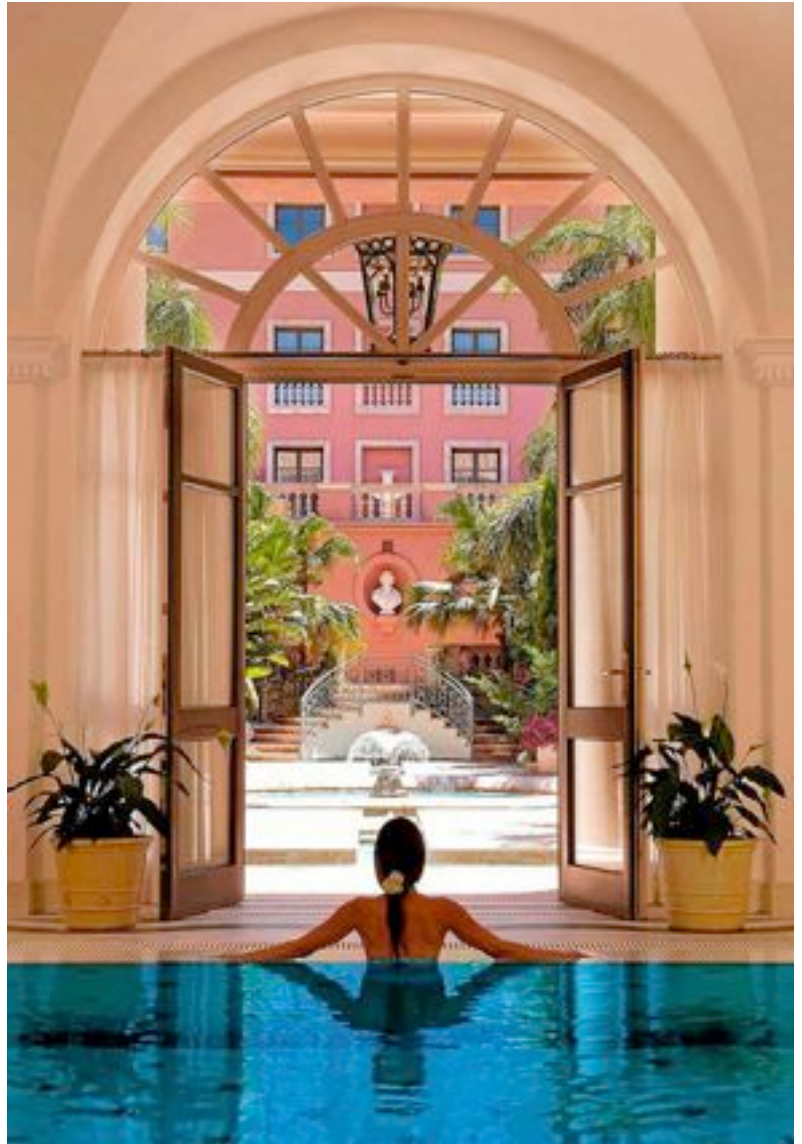
Las piscinas residenciales de carácter privado y los balnearios, puntos fuertes del sector español.

Sin embargo, el estallido de la crisis inmobiliaria ha frenado durante los últimos años el avance de un mercado clave para la economía española. Igual que ocurre en la construcción, la rehabilitación se antoja como una de las soluciones más rentables para las empresas. «Actualmente están surgiendo buenas posibilidades de negocio en las reformas y mejora de las piscinas, y una