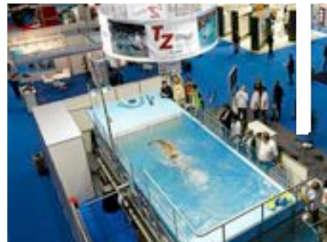
Anterior edición de Piscina.

Por otro lado, en las jornadas técnicas sobre Piscina Residencial se intentará descubrir cómo serán las instalaciones del futuro en el terreno del diseño y la sostenibilidad.