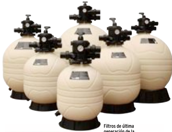
Filtros de última generación de la empresa Emaux.