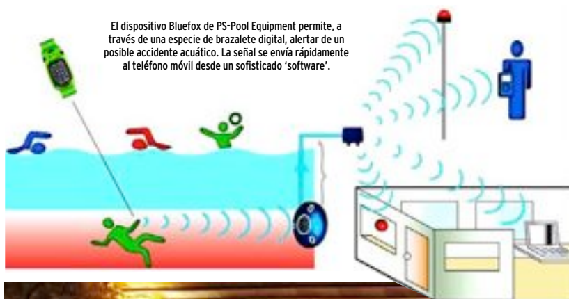
El dispositivo Bluefox de PS-Pool Equipment permite, a través de una especie de brazalete digital, alertar de un posible accidente acuático. La señal se envía rápidamente al teléfono móvil desde un sofisticado 'software'.