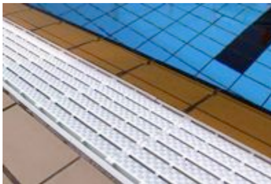
Rejilla estampada y protectora de Depatech.

En esta misma línea más sofisticada destacan las propuestas de Diamonds Spa. Jacuzzis o bañeras de hidromasaje para estan-